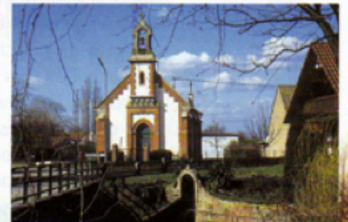
Le temple protestant, construit en 1878, devenu lieu de culte de la paroisse protestante du Ried-Nord.